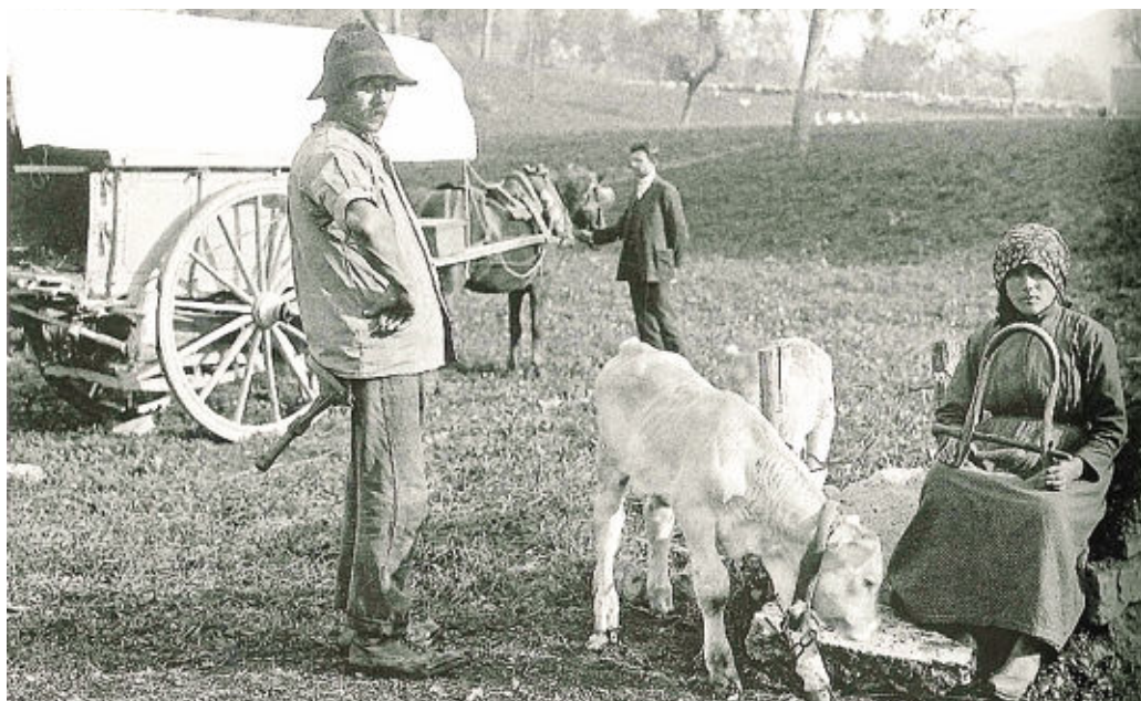
Il carro del bergamini pronto per il viaggio verso la pianura. Sul carro prenderanno posto anche i vitelli