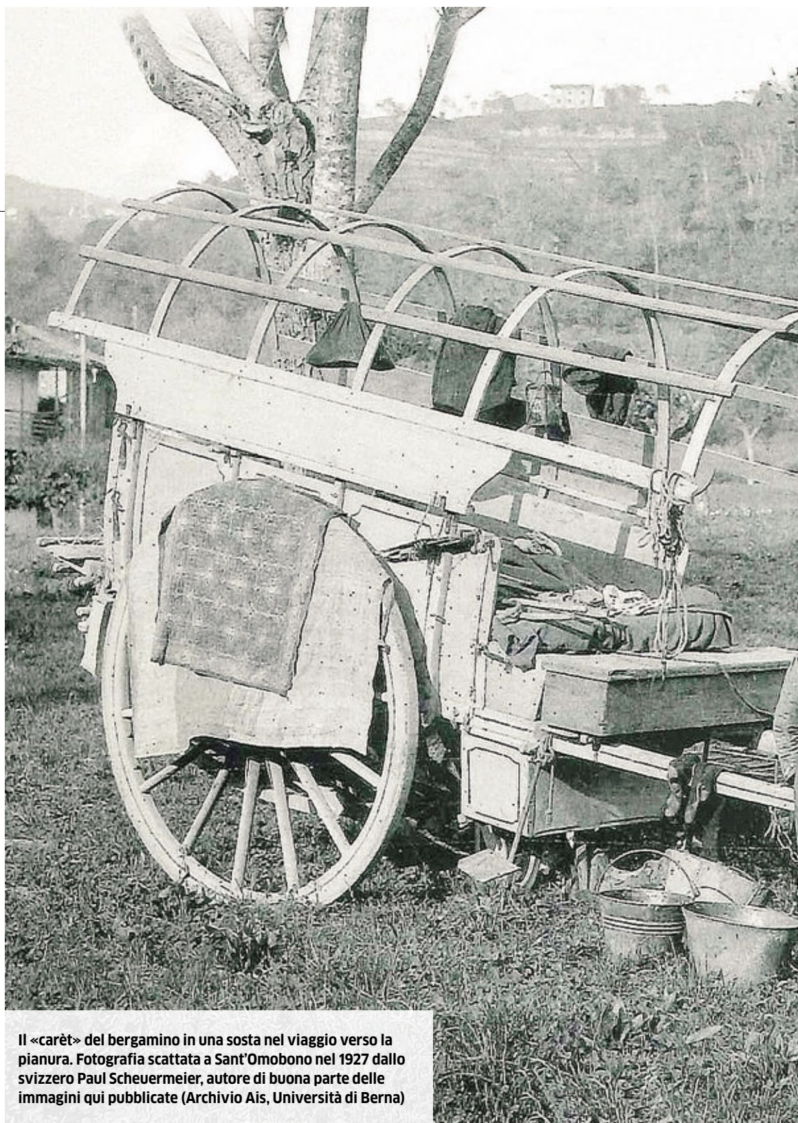
Il «carèt» del bergamino in una sosta nel viaggio verso la pianura. Fotografia scattata a Sant'Omobono nel 1927 dallo svizzero Paul Scheuermeier, autore di buona parte delle immagini qui pubblicate (Archivio Ais, Università di Berna)

Cifre da «popolo viaggiante» che contribuì allo sviluppo della montagna. «La figura del bergamino - sottolinea Antonio Carminati nelle pagine dedicate all'«orgoglio bergamino» in apertura a quanto scrive il prof. Corti - spiccava nella scala sociale dell'antico mondo contadino, per caratteri, comportamenti e capacità di adattamento: mentre all'interno di quel mondo egli era collocato ai vertici della scala economica locale, ossia era equiparato alla persona benestante e al scior». Non solo, la presenza dei bergamini e delle loro mandrie hanno contribuito a «disegnare» l'ambiente delle valli e a porle in relazione con la pianura: «La figura