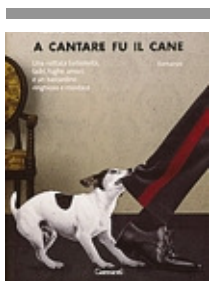
La copertina del libro A cantare fu il cane

«Se Camilleri non s'arrabbia, la definizioni mi onora - commenta Vitali -. Per me, come per molti, è un autore di riferimento. Quello che ha riaperto la via a un certo tipo di narrativa italiana, finita nel dimenticatoio dopo i fasti di Piero Chiara o Giovanni Arpino. Ha ridato agli italiani il gusto di leggere storie italiane». In realtà, Vitali nulla ha a che fare con il «pastiche», l'ibridazione linguistica, il siciliano per tutti di Camilleri. E nemmeno tanto, propriamente, con il giallo vero e proprio, fondato su delitti, sangue, indagini, commissario seriale.