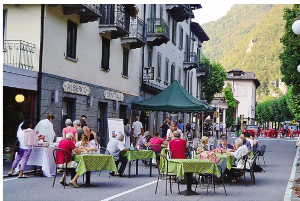
Tavolini in strada a San Pellegrino: l'iniziativa sta prendendo piede e sarà replicata