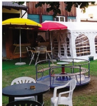
Uno scorcio dell'Osteria al parco

È la novità dell'estate, apprezzata da villeggianti e residenti nella frescura del parco pubblico. Per tutto il mese di agosto è aperta a Moio de' Calvi «L'osteria del Moi», arrivata ad allietare