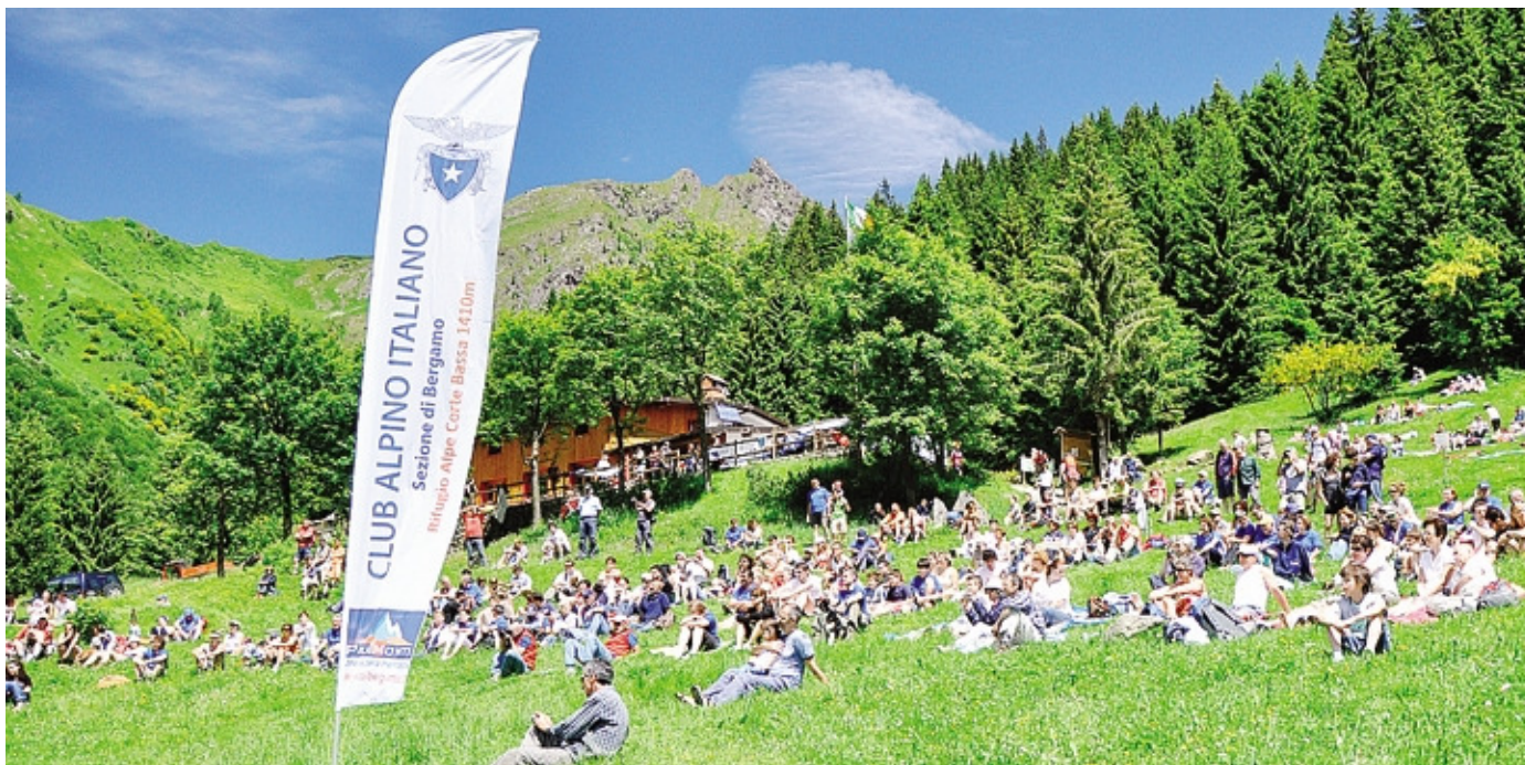
Un festoso incontro sui prati al rifugio Alpe Corte, tradizionale meta per famiglie e piccoli escursionisti

Cisone altri protagonisti che di solito non compaiono mai molto, anche in questa piacevole e utilissima guida di Roberto Cremaschi «In montagna con i bambini» arrivata in libreria giusto all'inizio della stagione delle escursioni. L'autore, al quale si devono altre guide tra cui «In Malga Lunga. 17 passeggiate resistenti», «La strada dei monti. 26 itinerari sui luoghi della Resistenza bergamasca», «Alle porte di Città Alta». Sono in onni. Ma l'autore è pronto a rispondere ad eventuali obiezioni di chi, capelli radi e ormai sul bianco, si fa forte dell'esperienza di mettere in cammino in compagnia dei nipotini.