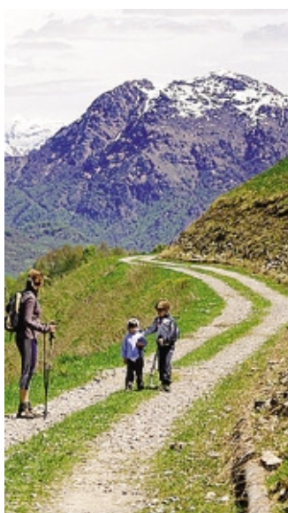
Dalla Costa del Palio a Morteronone

cleo di Morteronone. Una gita facile, adatta anche a famiglie. Il programma prevede l'appuntamento dei partecipanti per le ore 15 all'antica dimora di Cà Berizzi (via Regorda 7, Corna Imagna) da dove si proseguirà per Fuipiano salendo quindi alla Costa del Palio e tappa finale Morteronone. Dopo la cena al sacco, incontro con