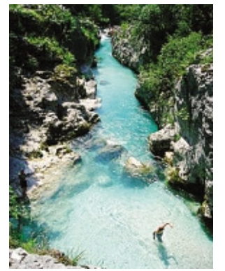
L'Isonzo nel Parco Triglav

ESCURSIONISMO. Domani partenza del lungo trekking in Slovenia: una settimana nel Parco nazionale del Triglav, tra i parchi più antichi d'Europa. Tra l'altro, è programmata un'escursione sul Sentiero dell'Isonzo, itinerario didattico del parco lungo il fiume, con tratti di sentiero