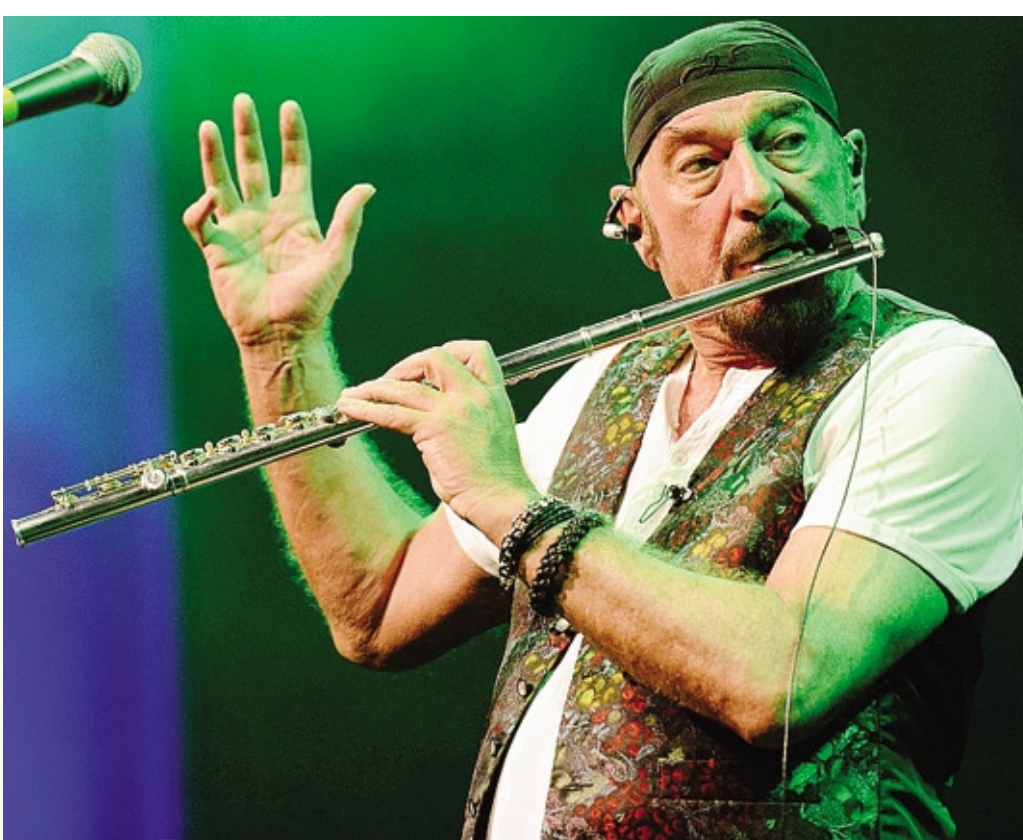
Ian Anderson con il suo flauto è il leader dei Jethro Tull dalla loro nascita