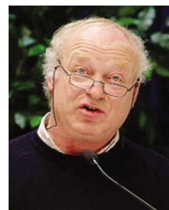
Monsignor Leone Lussana