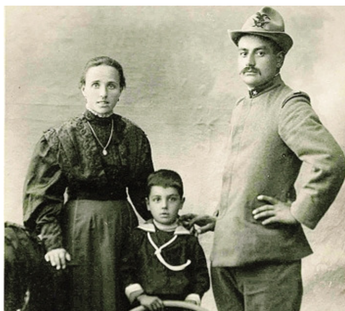
La Fiorini e il Biondo con uno dei loro quattro figli

Una serata con ancora il sapore delle cose buone di un tempo, sul filo di un delicato amore coniugale e di forti legami non soltanto tra la coppia - il Biondo e la Fiorini - ma anche tra l'intera compagine parentale, ai quei tempi particolarmente estesa.