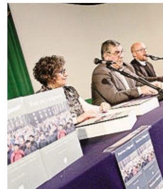
La presentazione del libro ZANCHI

«Sembrava certa l'agonia delle missioni cattoliche fra i migranti italiani in Europa. Invece, il fenomeno della nuova emigrazione italiana, impresso dalla crisi economica, rende molto attuale la loro presenza, pur riadattata al nostro tempo».